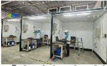
မြောက်အုပ်သင်တန်းကျောင်းမှ လျှပ်စစ်သင်တန်းကျောင်း

၂၀၂၄ မှ ၂၀၂၆ ထိ ဝဋ္ဋအကြိမ် အလုပ်အကိုင်ဆိုင်ရာကျွမ်းကျင်မှု လေ့ကျင့်ရေးသင်တန်းကျောင်း သက်တမ်းတိုးမှတ်ပုံတင်လက်မှတ်