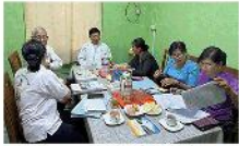
သာကေတသင်တန်းကျောင်း